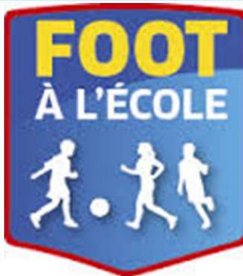
Gestion des rencontres / table de marque