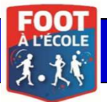
Fiche d'aide à l'organisation TOURNOI FUTSAL A 4 EQUIPES