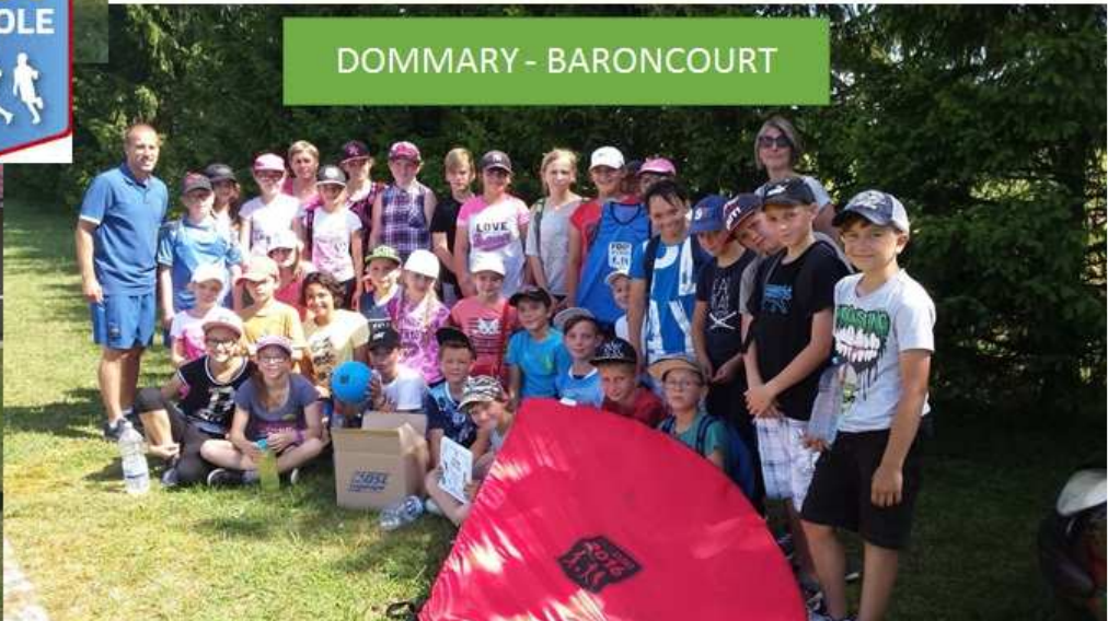
DOMMARY - BARONCOURT