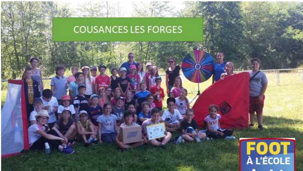
COUSANCES LES FORGES