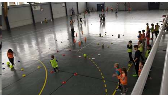
ATELIERS / JEUX SCOLAIRES