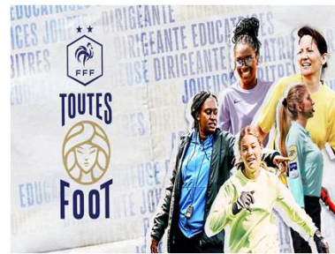
Vidéo ASL Mangiennes